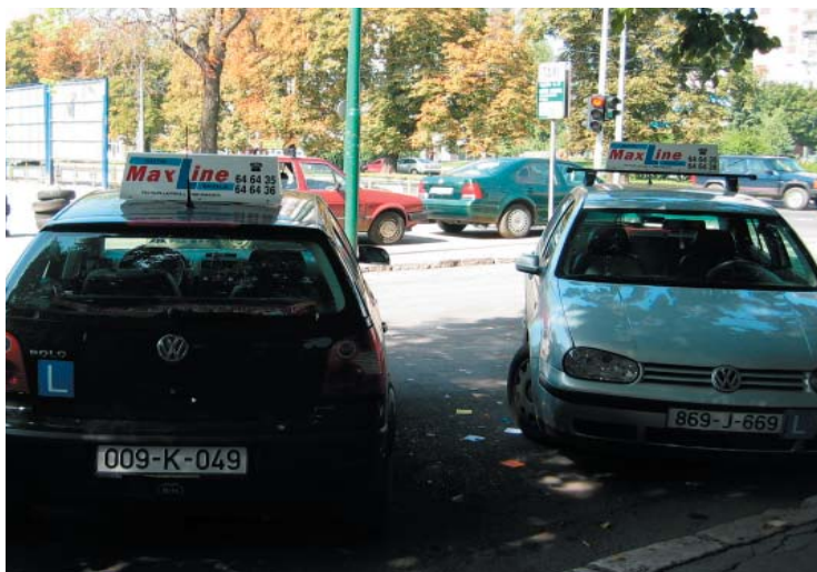
Vrhunska obuka kandidata za a,b,c kategoriju