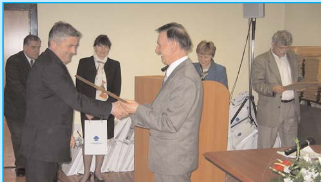
Četvrta svečana dodjela članskih kartica i plaketa održana 3. juna.