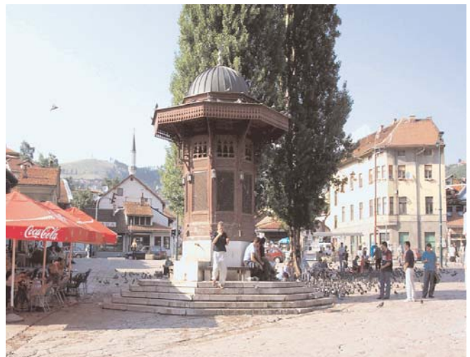
Upoznati vrijednosti Sarajeva

«Ovo je izvanredna prilika da predstavimo naše kulturne, prirodne, ali i sve druge vrijednosti», kazao je prilikom potpisivanja premijer Zvizdić.