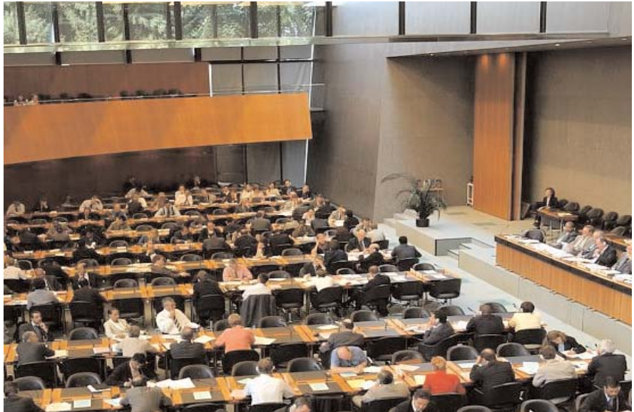
Trgovinski pregovarački komitet

WTO World Trade Organisation - Svjetska trgovinska organizacija je jedino međunarodno tijelo koje se bavi pravilima trgovanja među državama. U njenoj osnovi su dva WTO sporazuma postignuta i potpisana od većina svjetskih trgovinskih nacija. Ovi dokumenti predstavljaju zakonsku osnovu pravila međunarodnog trgovanja. To su u osnovi ugovori, koji obavezuju vlade da svoju trgovinsku politiku definiraju unutar dogovorenih granica. Iako su dogovore postigle i potpisale vlade, cilj ovih dokumenata je pomoći proizvođačima roba i usluga, izvoznicima i uvoznicima da obavljaju svoj posao.