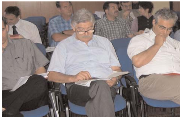
Ministar Zlatko Petrović sa saradnicima

Na osmoj sjednici Savjeta za građevinarstvo, IGM i projektantske usluge, održanoj 24. juna diskutovano se o izmjeni odluka o utvrđivanju bazne cijene za određivanje naknade za uređenje gradskog građevinskog zemljišta i odluka o utvrđivanju visine rente.