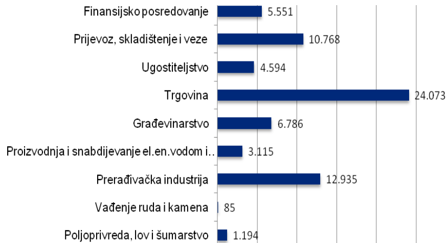
Broj zaposlenih u Kantonu Sarajevo u privrednim djelatnostima (Juli 2012 )